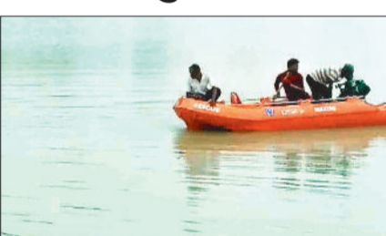
जा रही थी लेकिन दिनभर चलाए अभियान के बाद भी युवक का शव नहीं मिला पाया था।

सीतापुर। नहाने के दौरान बांध में डूबे 32 वर्षीय युवक का शव बरामद कर लिया है। घटना के बाद चलाए सच अभियान के दौरान 24 घंटे बाद एसडीआरएफ ने शव को बरामद किया है। पुलिस द्वारा मृतक के शव को पीएम उपरान्त परियोजना के सुपुर्द कर दिया है। इस घटना से क्षेत्र में शोक का माहौल है।